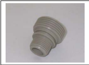
PE / PP Einschraubteile -gedreht - mit Dichtung seitlich Sonderabmessungen