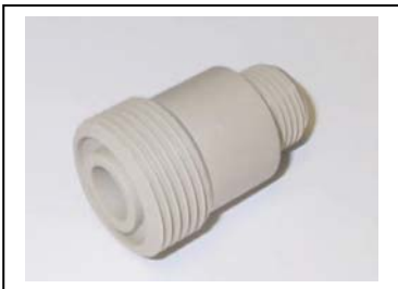
PE / PP Einschraubteile -gedreht - mit Dichtnut kopfseitig Sonderabmessungen