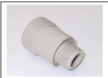
PE / PP Einschraubteile -gedreht - ohne Dichtnut Sonderabmessungen